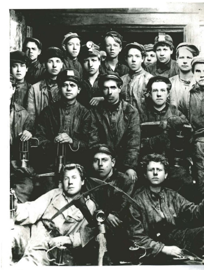
1929 г. Первая комсомольская – молодежная бригада ш.Центральная.

31. Шпаленкова, М. Нам всем 15 / М. Шпаленкова // Шахтерская правда. – 2008. – 26 сентября (№ 109). – С. 3.